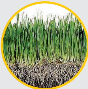
Menggalakkan Pertumbuhan Akar